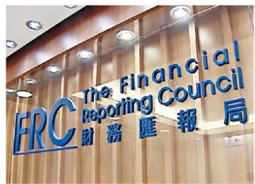
財匯局接過監管核數師的權力後，監管手法較以往嚴厲。

至於停牌原因方面，根據致同會計師事務所的統計，截至今年8月底為止，50%的上市公司停牌個案，均是由核數師