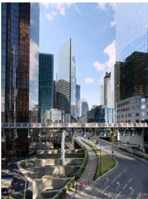
Francouzská centrála Mazars sídlí v pařížské čtvrti La Défense