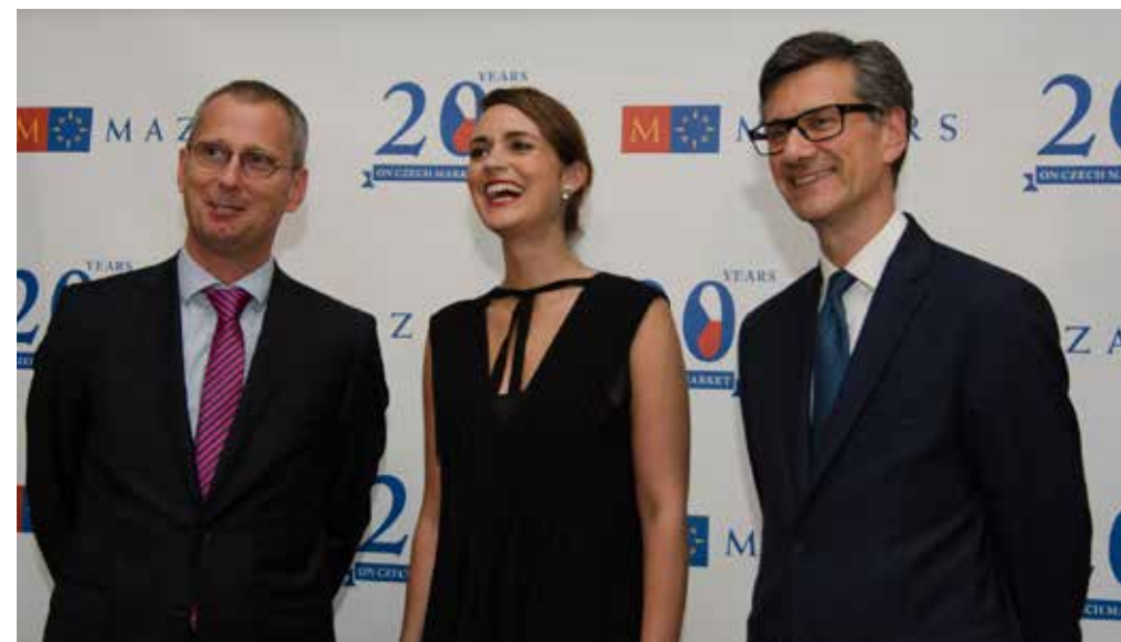
Oslava 20 let působení Mazars v České republice

znali jen francouzské předpisy a samozřejmě neuměli ani slovo česky, my jsme znali zase jen české. Trávili jsme tak hodně času po kavárnách, kde jsme si navzájem předčítali